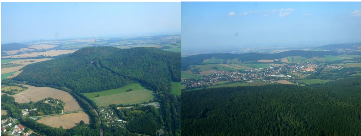
Bild1 & 2: Vorbei am Löbauer Berg (1) und Wilthen (2)